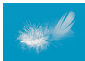
Plumettes de canards