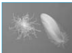
Peluria con piumette