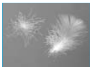
Piumette con peluria