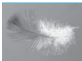
Plumes de canards